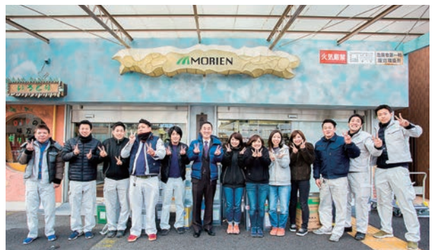
本社社屋と従業員の皆さん

2006年頃には、webショップでの販売も開始しました。今までですとホームセンターで塗料を購入したものの説明がないため使い方がわからなかったり、間違った使い方をしていたり困っておられるお客様が多数いらっしゃいました。そんな中当社のweb販売では質問にもお答えすることができますので、購入の際に色々聞くことができ良かったとご好評をいただいています。