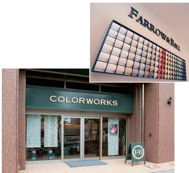
ショールームの様子

ホームセンターや訪問販売が市場を広げてきている現状を受け、販売店の存在意義が問われていると思います。最近は異業種が参入してきており危機感を感じていますが、逆にそれだけうまみがあり改善の余地がある業界でもあると感じています。そういった異業種から学んでいくことも大切だと考えています。