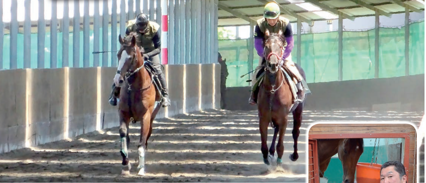
有限会社ベーシカル・コーチング・スクール