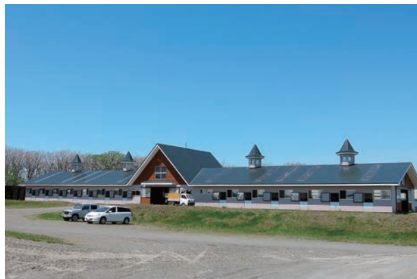
厩舎の様子。PSマイルドSコートが光沢を放つ。

必要ですので、今回塗り替えを行なうこととなりました。海が近い、舗装路面が少なく埃が立つといった立地条件から長持ち、はっ水性、耐候性の良いものを希望しており、提案された中で当時新発売ということもあり屋根はPSマイルドSコートをおすすめされて決定しました。屋根をシリコン樹脂塗料で施工となったので、壁も同じくシリコンのもので施工したかったのですが、面積がかなりあるため予算面で諦めていたところ、水谷ペイントさんが頑張ってくれたとのことで、壁もマイルドSiで施工する事となりました。