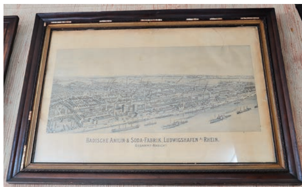
創業当時の仕入先であったドイツの染料メーカーの工場画。

サクスは結婚を機にはじめて今では息子と一緒に音楽教室へ通っています。多種ある楽器の中でサクスにしようと思ったきっかけは、ギターやピアノは周りに出来る人が何人かいたので、別の楽器に