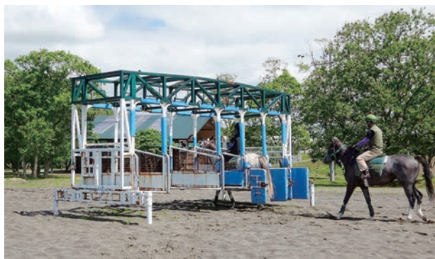
調教業務の様子。馬は狭い所を嫌うので、スタート前に入るゲートに慣れさせる訓練を行なう。