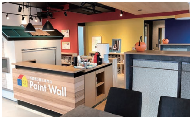
ペイントウォールの様子