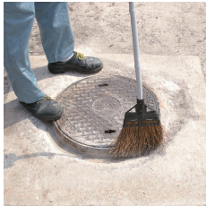
被塗面のゴミ・ホコリを除去