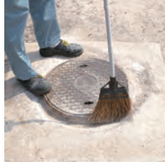
被塗面のゴミ・ホコリを除去