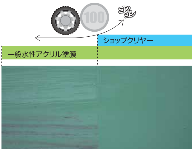
上図は一般水性アクリル塗料の上にショップクリヤーを塗装してタイヤ片及びコインで擦りつけたときの汚染及び擦り傷の状態を表しています。

ショップクリヤーを塗装した床面はタイヤマーク(ヒールマーク)が付きにくく、傷もつきにくい!