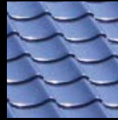
プレスセメントがわら