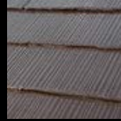
住宅屋根用化粧スレート