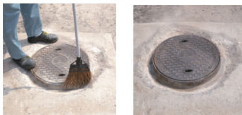
被塗面のゴミ・ホコリを除去