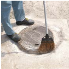
被塗面のゴミ・ホコリを除去