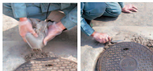
ネタ配り コテならし