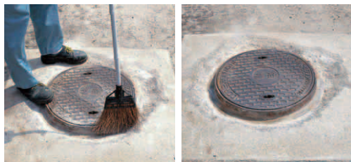
被塗面のゴミ・ホコリを除去 素地調整完了