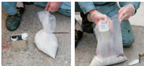
材料の準備 樹脂液の投入